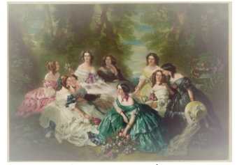
The empress Eugénie Franz-Xaver Winterhalter, 1855

"Il principio della saggezza è il timore del Signore, e conoscere il Santo è l'intelligenza" (Proverbi 9:10)