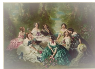
The empress Eugénie Franz-Xaver Winterhalter, 1855

"Il principio della saggezza è il timore del Signore, e conoscere il Santo è l'intelligenza" (Proverbi 9:10)